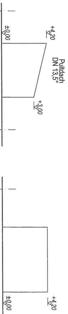
ANSICHT VON OSTEN (DARSTELLUNG VEREINFACHT)